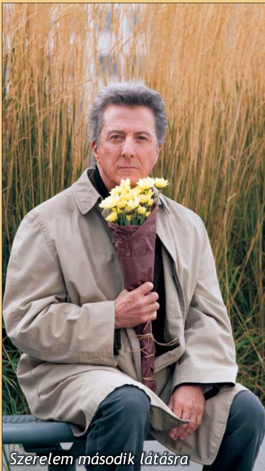
Szerelmem második látásra